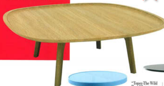
"Hug", design Jean-Marc Gady, en chêne massif. L. 90 x l. 90 x H. 38 cm. Perrouin , à partir de 1 090 €.