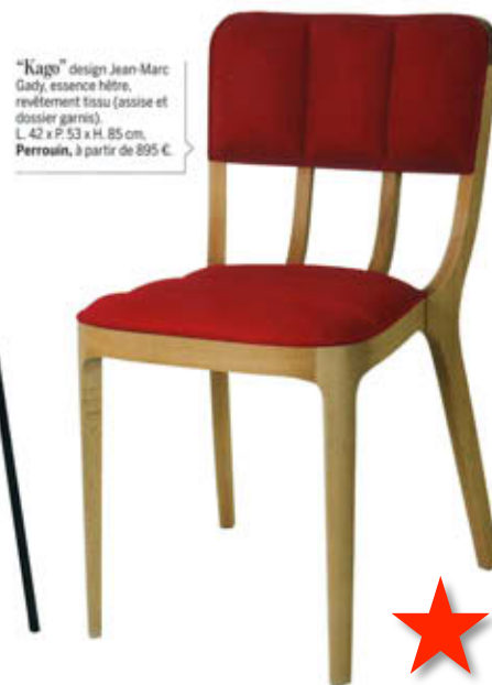
"Kago" design Jean-Marc Gady, essence hêtre, revêtement tissu (assise et dossier garnis). L. 42 x P. 53 x H. 85 cm, Perrouin , à partir de 895 €.