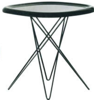
"Pizza", design Naoto Fukasawa, structure en tube d'acier verni et plateau en ABS. Ø 46 x H. 46 cm et Ø 46 x H. 70 cm. Magis , 138 € et 150 €