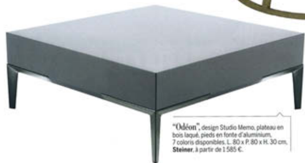
"Odéon", design Studio Memo, plateau en bois laqué, pieds en fonte d'aluminium, 7 coloris disponibles. L. 80 x P. 80 x H. 30 cm. Steiner , à partir de 1 585 €.