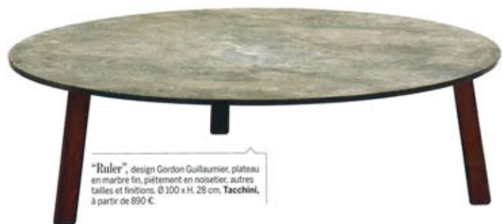
"Ruler", design Gordon Guillaumier, plateau en marbre fin, piétement en noisetier, autres tailles et finitions. Ø 100 x H. 28 cm. Tacchini , à partir de 890 €.