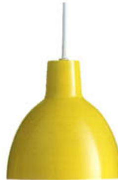
"Toldbod 120", en aluminium, disponible en différentes couleurs. Ø 12 x H. 12 cm. Louis Poulsen , 200 €