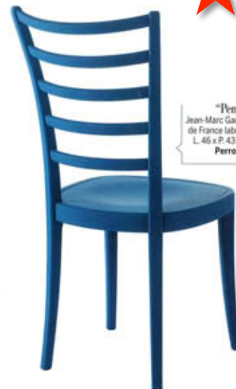
"Pemp", design Jean-Marc Gady, en hêtre de France labellisé PEFC. L. 46 x P. 43 x H. 95 cm, Perrouin , 330 €.