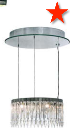
"Lady Crinoline", design Jean-Marc Gady, lustre composé d'une couronne de prismes à dard en cristal clair. Ø 55 x H. 23,4 cm. Baccarat , à partir de 10 300 €