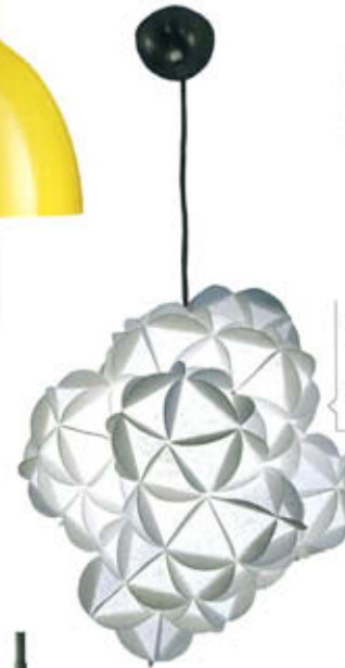
"Nuage", design Anne-Pierre Malval, en polyphane habillé de papier plié à la main. Plusieurs tailles. Ø 30 cm. Anne-Pierre Malval , 250 €