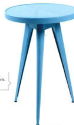
"00", design Jean Pauchard, en acier laqué, nombreux coloris. Ø 52 x H. 74 cm. Tolix , 418 €.