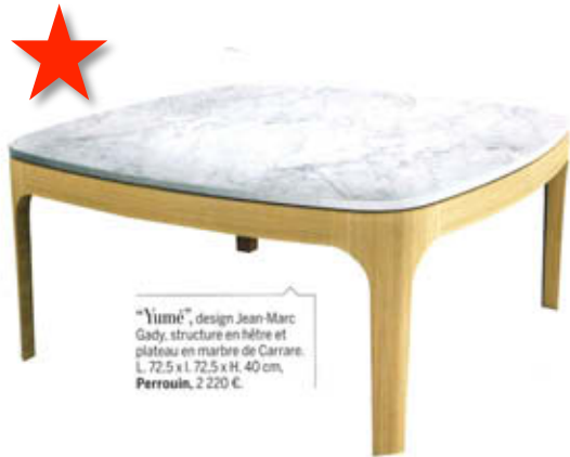
"Yumé", design Jean-Marc Gady, structure en hêtre et plateau en marbre de Carrare. L. 72,5 x L. 72,5 x H. 40 cm. Perrouin , 2 220 €