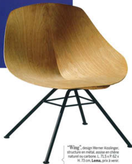
"Wing", design Werner Aisslinger, structure en métal, assise en chêne naturel ou carbone. L. 71,5 x P. 62 x H. 73 cm, Lema , prix à venir.