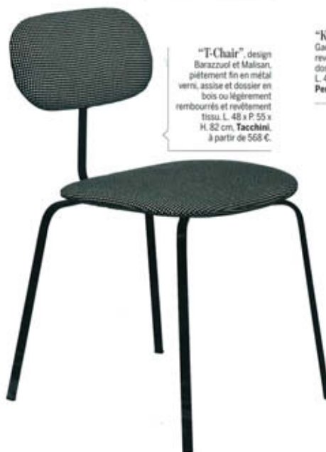
"T-Chair", design Barazzuol et Malisan, piètement fin en métal verni, assise et dossier en bois ou légèrement rembourrés et revêtement tissu. L. 48 x P. 55 x H. 82 cm, Tacchini , à partir de 568 €.