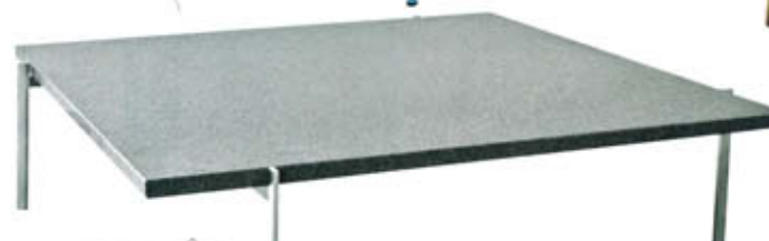
"PK61", design Poul Kjaerholm, en acier inoxydable satiné, plateaux ardoise, marbre clair, granit ou verre. L. 80 x P. 80 x H. 32 cm. Fritz Hansen , à partir de 2 846 €.