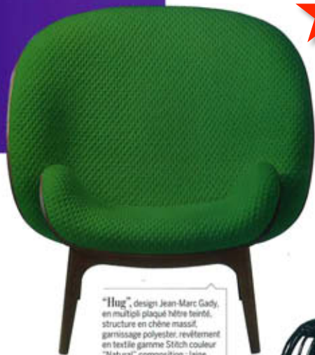
"Hug", design Jean-Marc Gady, en multipli plaqué hêtre teinté, structure en chêne massif, garnissage polyester, revêtement en textile gamme Stüch couleur "Natural", composition : laine, polyester, élasthanne. L. 1 080 x P. 90 x H. 1 080 cm, Perrouin , à partir de 2 500 €.