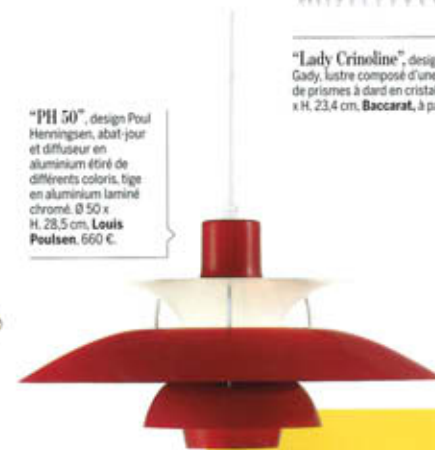
"PH 50", design Poul Henningsen, abat-jour et diffuseur en aluminium étiré de différents coloris, tige en aluminium laminé chromé. Ø 50 x H. 28,5 cm. Louis Poulsen , 660 €