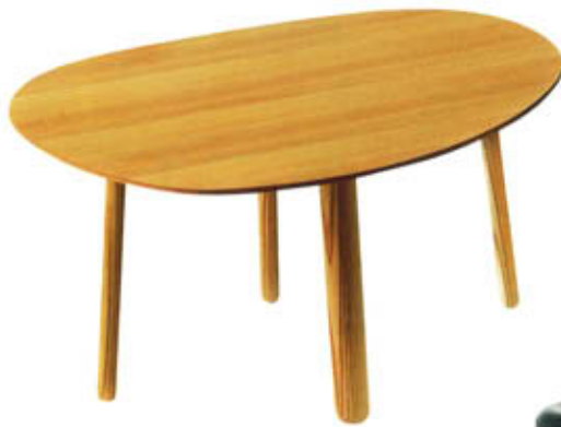
"Morris", design Kirsti Gullichsen, 5 modèles de plateaux ronds asymétriques, en médium stratifié brillant (16 coloris), ou placage chêne, pieds en chêne massif. L. 44 à 52 x H. 37 cm. La Boutique Danoise , à partir de 560 €