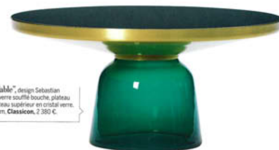
"Bell Coffee Table", design Sebastian Herkner, pied en verre soufflé bouche, plateau bas en métal, plateau supérieur en cristal verre. Ø 32/75 x H. 36 cm. Classicon , 2 380 €.