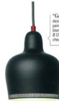
"Golden Bell A 330", design Alvar Aalto, en métal peint noir à l'extérieur et blanc à l'intérieur. Ø 17 x H. 20 cm. Artek chez Design-Ikonik , 369 €