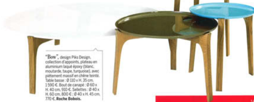
"Bow", design Pika Design, collection d'appoints, plateau en aluminium laqué époxy (blanc, moutarde, taupe, turquoise), avec piètement massif en chêne teinté. Table basse : Ø 110 x H. 35 cm, 1 500 €. Bout de canapé : Ø 60 x H. 40 cm, 910 €. Sellettes : Ø 40 x H. 60 cm, 800 € ; Ø 40 x H. 45 cm, 770 €. Roche Bobois .