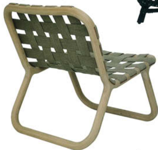
"Camping Chair", design Jesper K. Thomsen, structure en hêtre naturel et assise en sangles de toile épaisse tressées. L. 60 x P. 70 x H. 67 cm, Norman Copenhagen , 2 400 €.