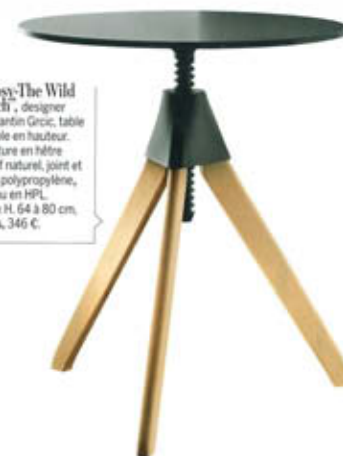
"Topsy-The Wild Bunch", designer Konstantin Grcic, table réglable en hauteur. Structure en hêtre massif naturel, joint et vis en polypropylène, plateau en HPL. Ø 60 x H. 64 à 80 cm. Magis , 346 €.