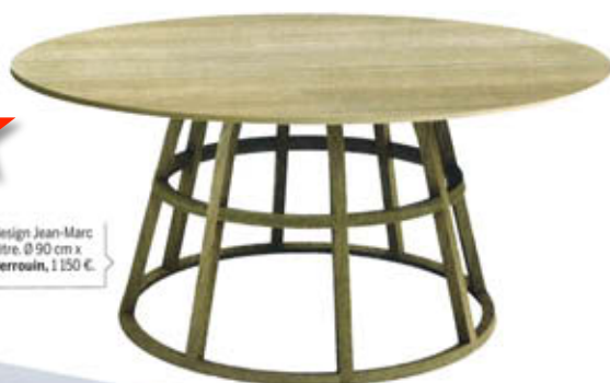
"Kago", design Jean-Marc Gady, en hêtre. Ø 90 cm x H. 41 cm. Perrouin , 1 150 €.